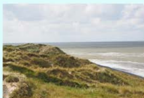
Sylt Hotel Roth am Strande 27.12. - 03.01.2027

Es gibt in der Turnierordnung tatsächlich in §2 eine Unterteilung in Turnierformen, die unterschiedliche Vorgaben haben, bspw. besondere Zulassungsbeschränkungen bei Deutschen Meisterschaften und es gibt Verfahrensregelungen, in denen nach der Art des Turniers unterschieden wird, zum Beispiel unterschiedliche Berechnungsbestimmungen, je nachdem, ob per Hand oder per Computer ausgerechnet wird. Das sind aber alle Bestimmungen, die sich auf die Durchführung des Turniers beschränken, nicht auf die Regeln selbst.