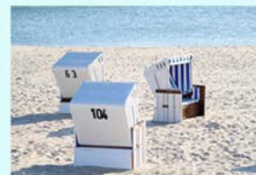
Sylt Hotel Roth am Strande 28.06. - 05.07.2026 05.07. - 12.07.2026 18.10. - 25.10.2026 Ab 1.216,00 €