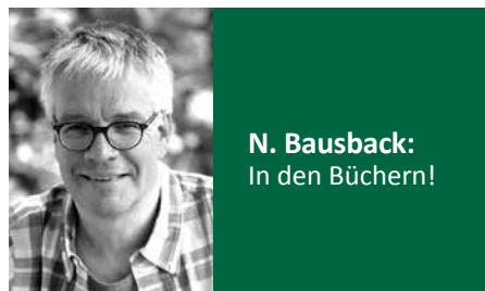
N. Bausback: In den Büchern!

R. Bley: 2♦. Die „cleveren“ Gebote wie 1SA oder 2♣ sind mir zu clever.