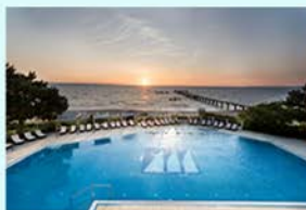
Timmendorfer Strand Maritim Seehotel 07.06. - 14.06.2026 Ab 1.435,00 € inkl. HP