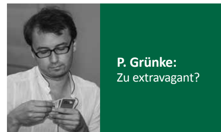
P. Grünke: Zu extravagant?

Klar, man sollte es dem Partner immer so einfach wie möglich machen, das ist oft leichter gesagt als getan. Hoch sperren möchte auch: