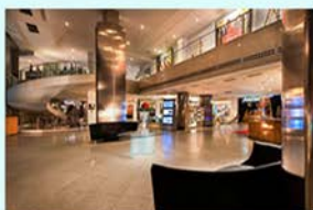
Berlin Maritim ProArte Hotel 27.12. - 03.01.2027