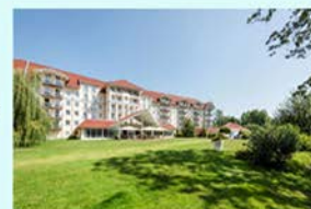
Allgäu - Ottobeuren Best Western Plus Parkhotel 21.09. - 30.09.2026 Ab 1.990,00 € inkl. HP