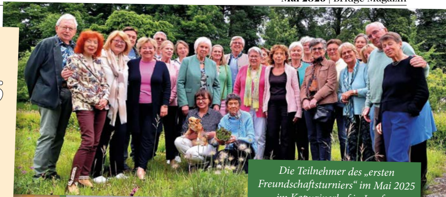
Die Teilnehmer des „ersten Freundschaftsturniers“ im Mai 2025 im Kapuzinerhof in Laufen.

dem 1. Bridge-Club Hansestadt Stralsund zum 25-jährigen Jubiläum